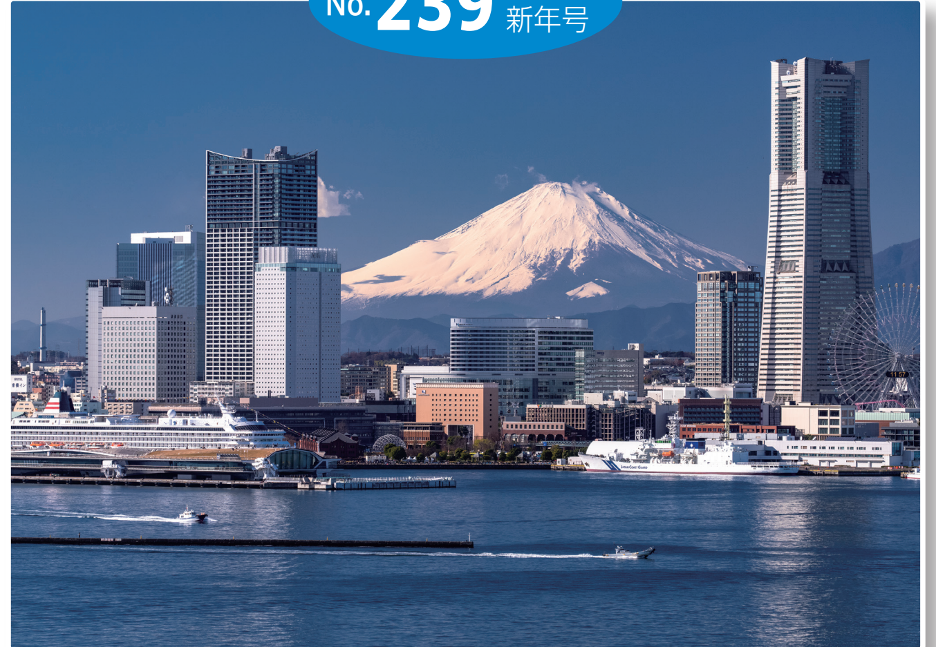
みなとみらいと富士山（神奈川県）